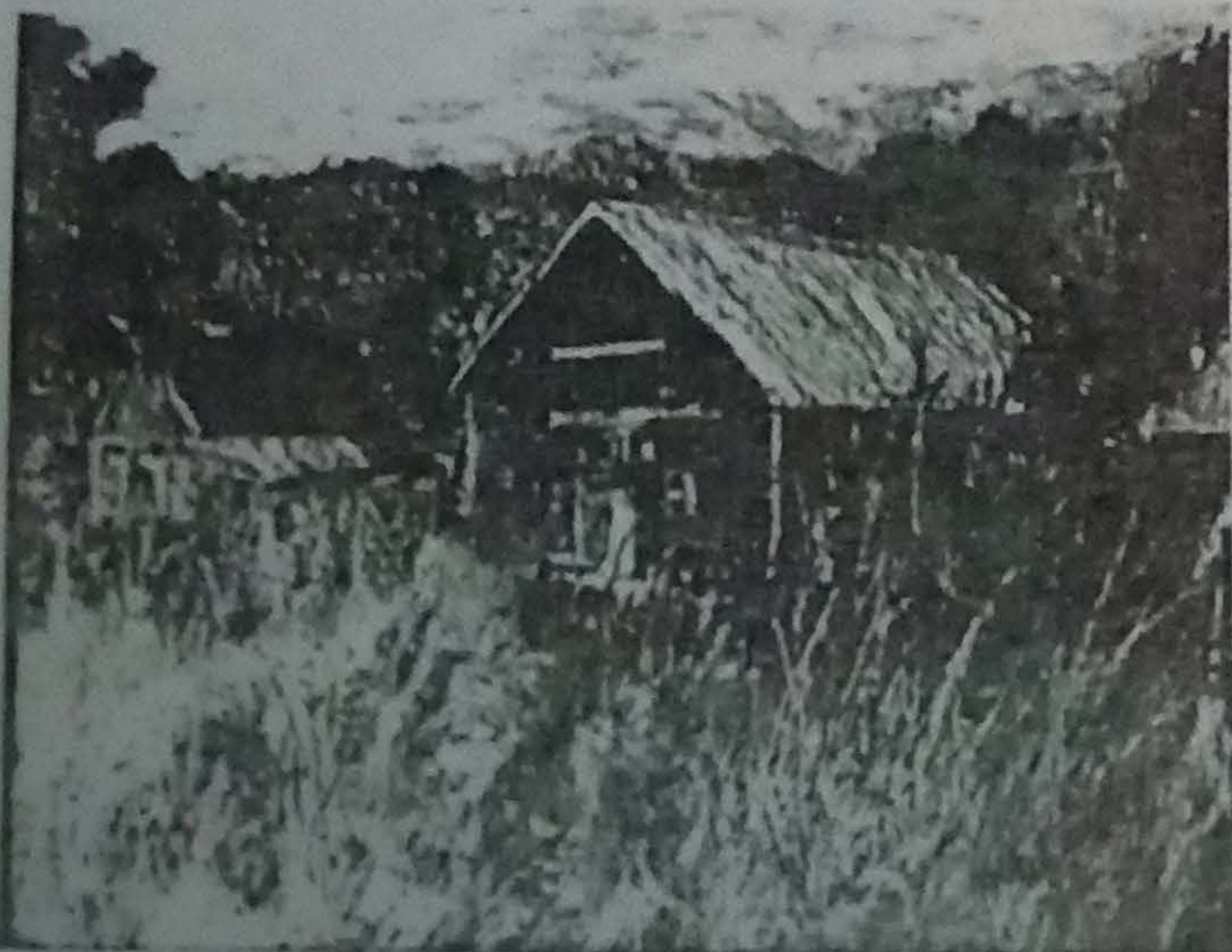
Une œuvre signée Jean-Pierre Délisle et qui représente une grange située à Saint-Paul de l'Île-aux-Noix.

Grâce à sa technique, il créé des tableaux flamboyants, des toiles où